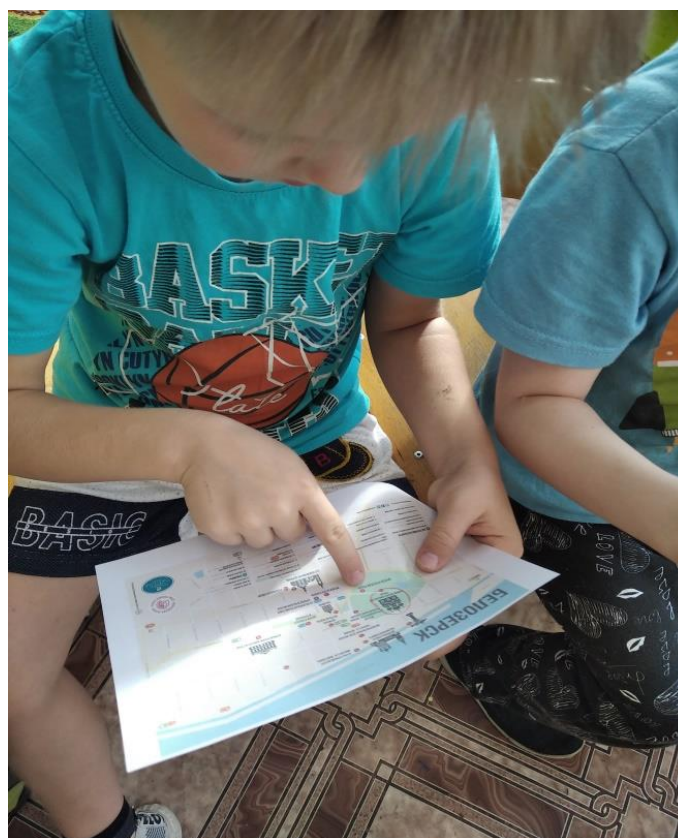
Приложение 2. Рассматривание маршрута