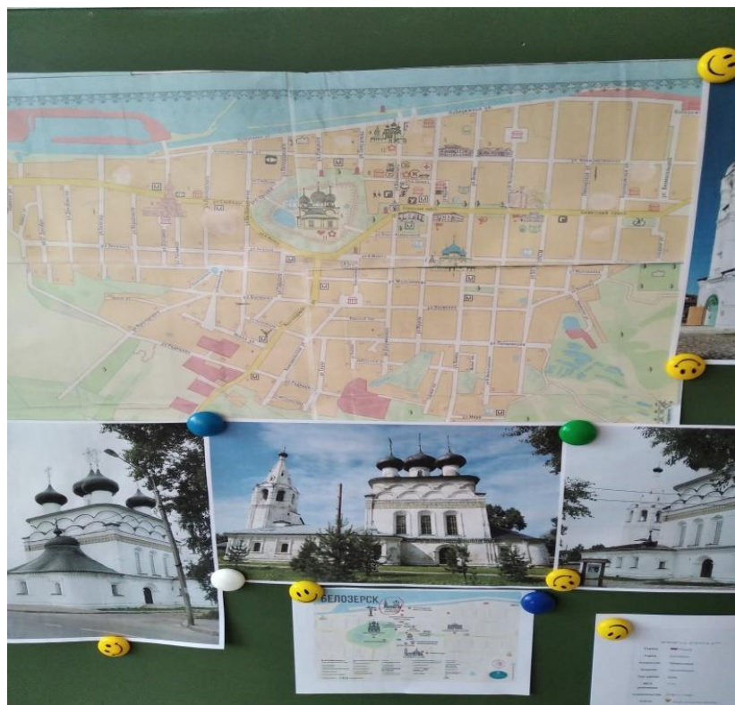
Приложение 1. Работа с картой