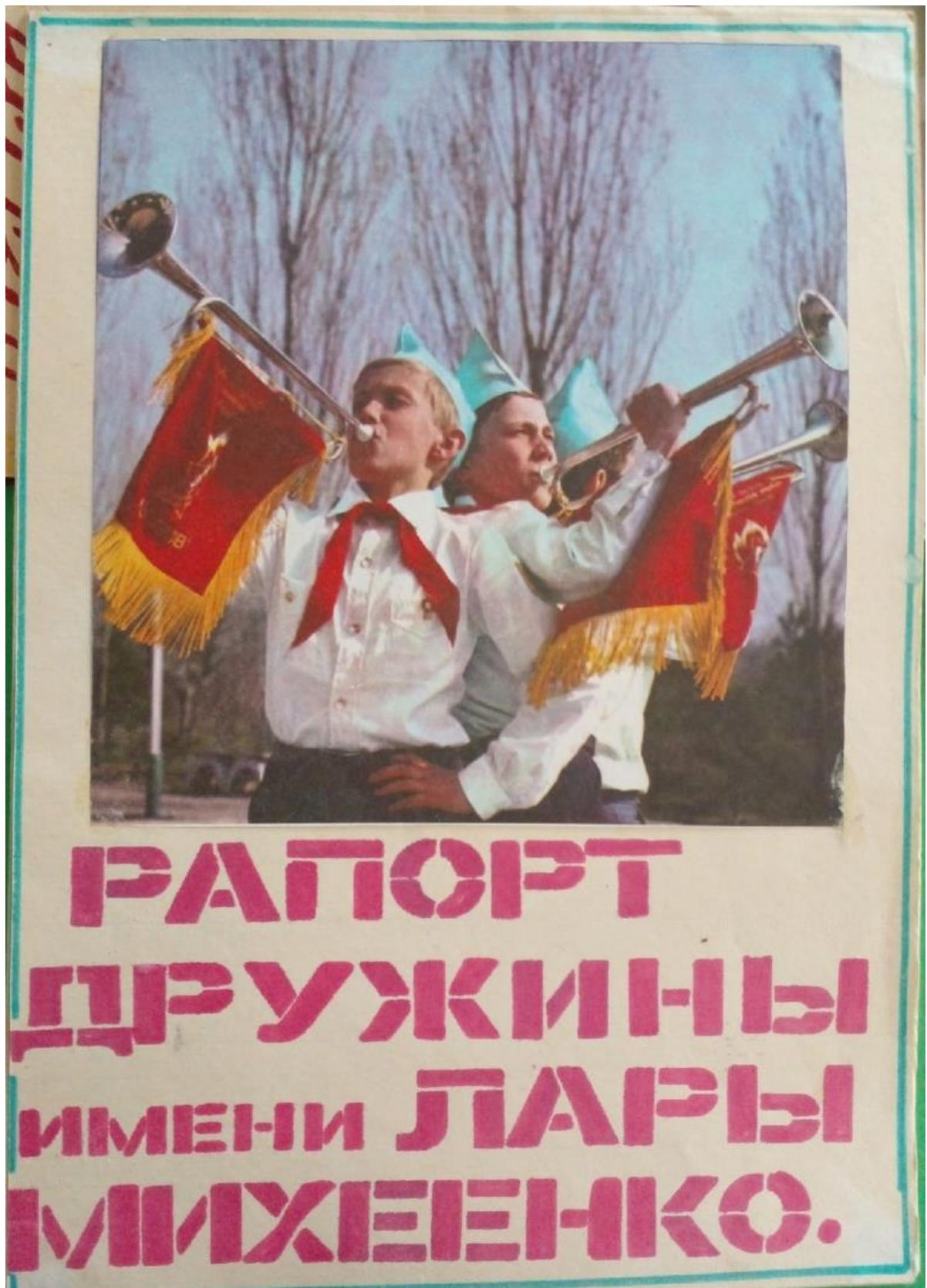
Приложение 5. Рапорт дружины Новокемской средней школы имени Лары Михиенко, 1987 год.