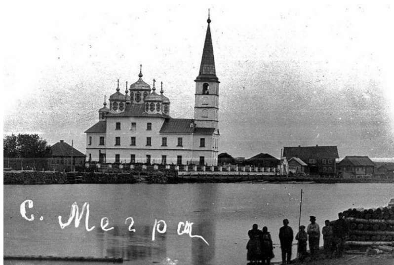
Илл. 1. Село Мегра. Фото.