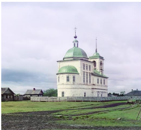
Фотография 1. Церковь Вознесения Господня. Фото Прокудина-Горского [9]. 1909

Двухэтажная кирпичная церковь Вознесения Господня была построена в городе Белозерске в 1776 году «На Беле ж озере на посаде <...> Церков господня Вознесения, в приделах преподобнаго Александра Свирского да преподобнаго Кирилла Новоезерского; другая святого Николая Чюдотворца» [3:137] (Фото 1). Церковь упоминается у П.И. Челищева в его дневнике «Путешествие по северу России в 1791 году»: «Вне земляного вала каменных, в шестнадцати приходах церквей 16 <...> б) Двухэтажная о четырех храмах: вверху Вознесению Господню; внизу настоящий –