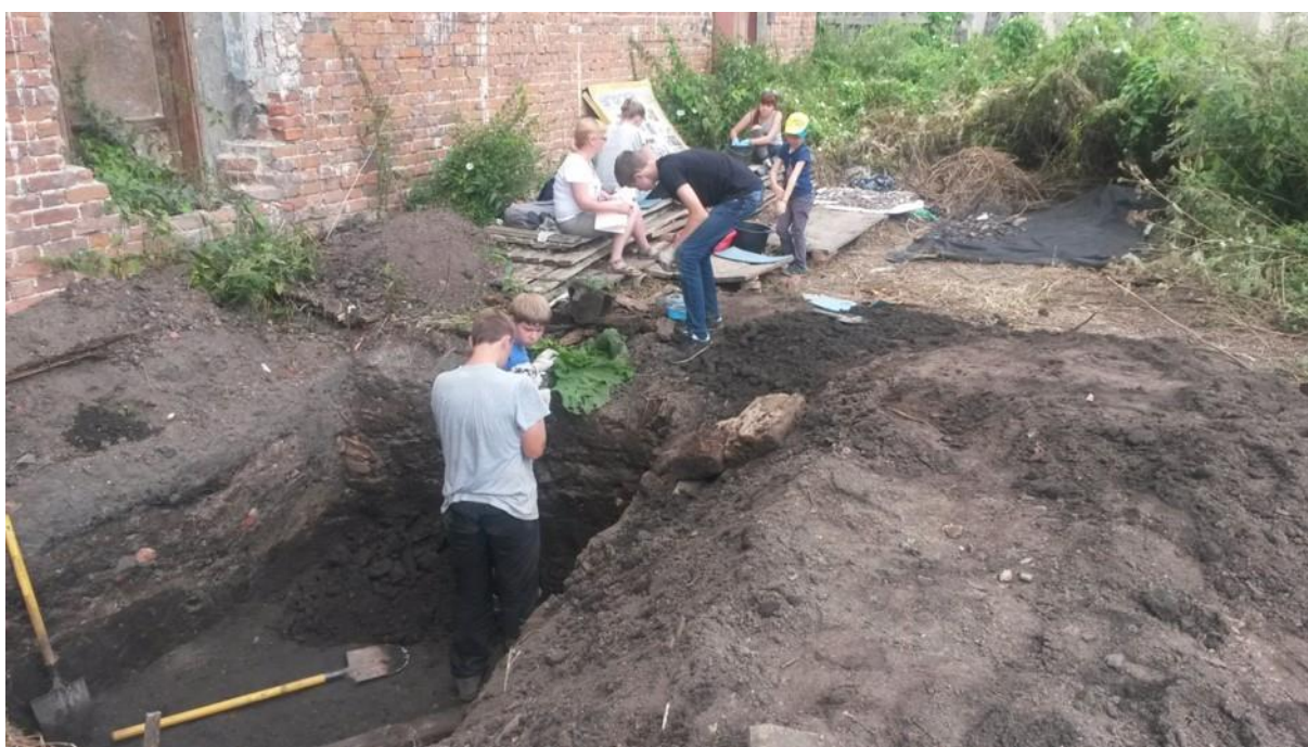
Рис. 4. Находки на археологических раскопках