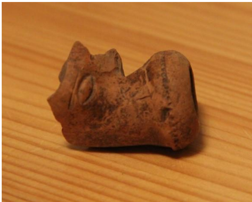
Рис. 1. Фрагмент курительной трубки