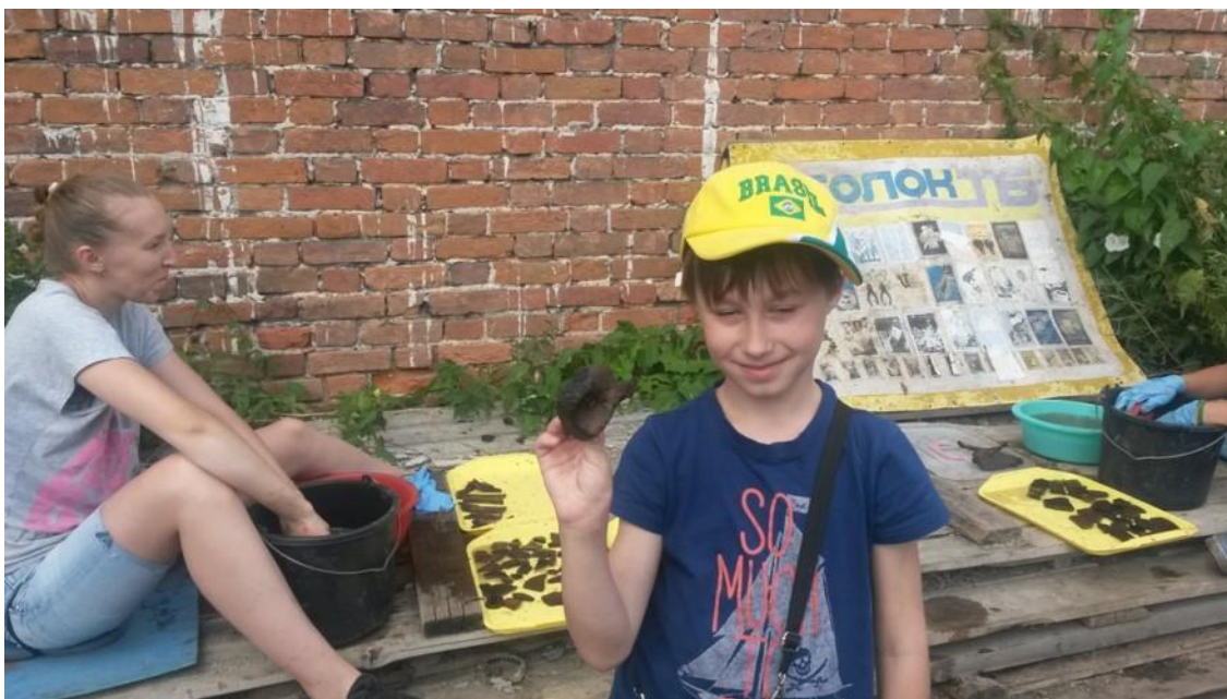
Рис. 3. Находки на археологических раскопках