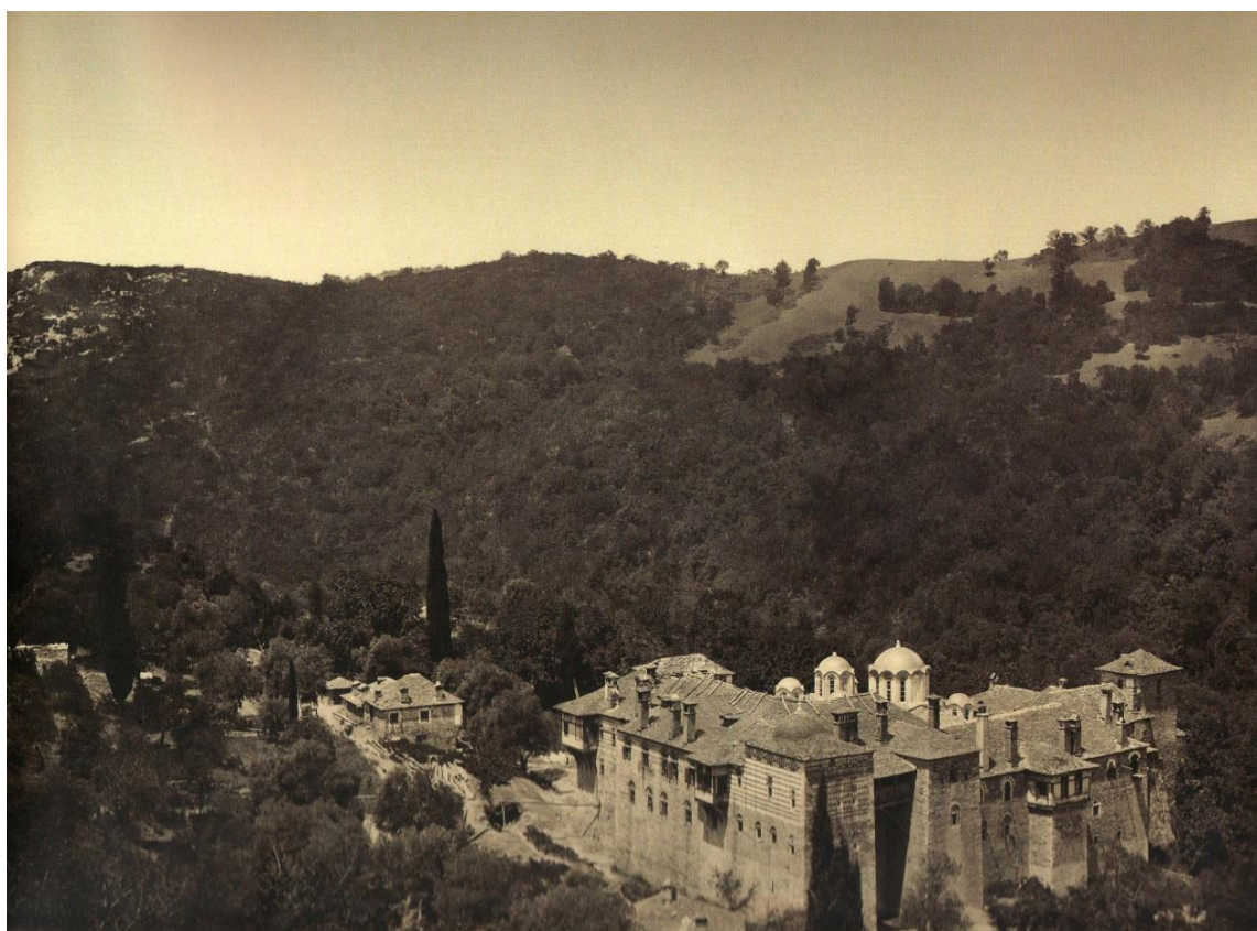
Илл. 2. Канстамонитов монастырь. 1867–1872.