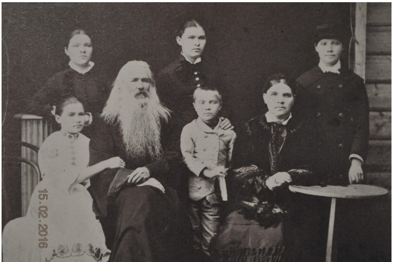
Ил. 2. Семья Беляевых, около 1880 г.